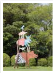
Construction Kit Animal