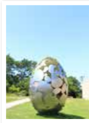
はじまりのはじまり