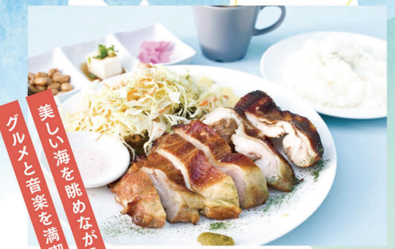
焼製チキンステーキ¥1,350

海のそばに建つ、レストラン併設ライブハウス。一手間掛けたランチが味わえる他、定期的にライブも開催！ゲストハウス宿泊やBBQも可。