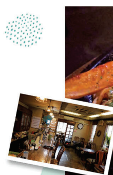
イタリアンスパゲティ(目玉焼き付)¥800

地元で長年愛される喫茶店は、大人気の日替わりランチ¥800~など手作り料理が大充実！自慢のコーヒーと一緒に堪能して。