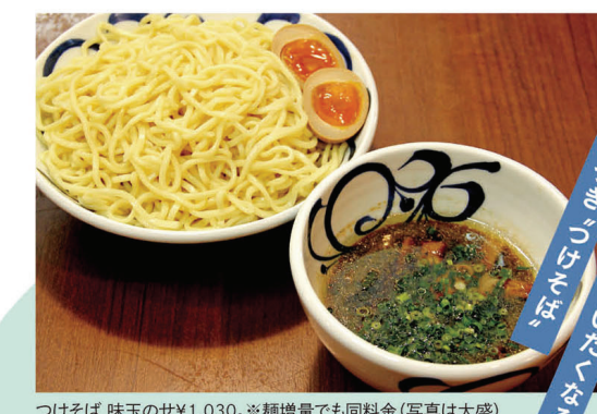
つけそば 味玉のせ¥1,030。 ※麺増量でも同料金(写真は大盛)

看板メニューは、つけそば。毎日丁寧に作る極太の自家製麺と、完全無化調の酸味あるスープで、安心・新鮮の一杯が楽しめます。