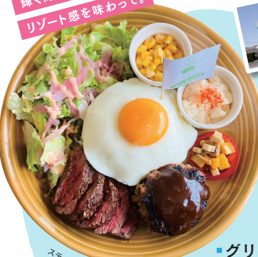
ステーキ&ハンバーグプレート ¥1,500