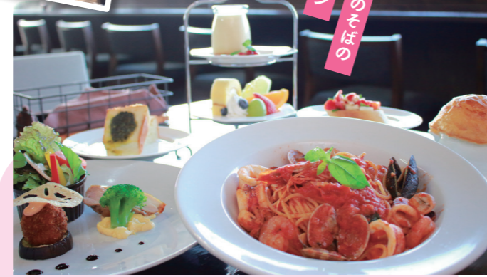
お得なランチコースもあり(写真はオペラ ¥2,980~)