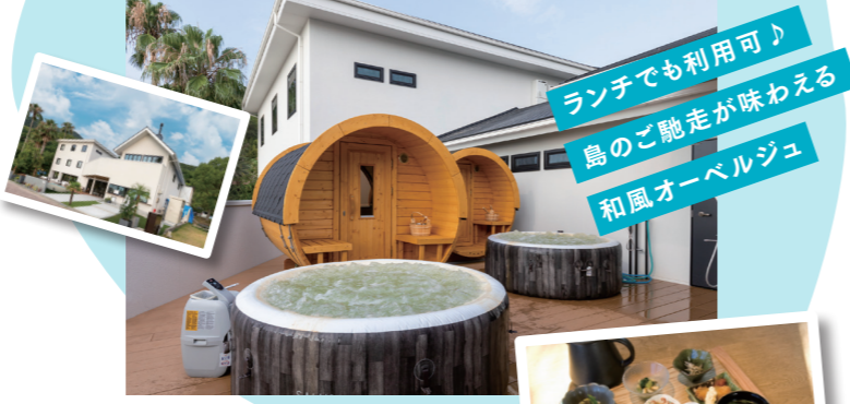
宿泊者限定サウナも人気。

■ SAUNA & FISHING HOTEL セトノウツ 周防大島町大字平野1184 ☎0820-78-0220 ※ゆゑゆゑは050-5589-7969 ☎ゆゑゆゑ/11:30~15:00(14:00 L.O) ☎不定休(要問合せ) ☎ホテル裏にあり https://setonoututu.jp/