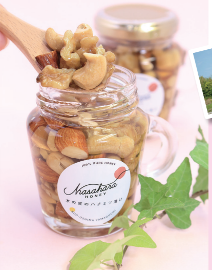
木の実はちみつ漬け(120g) ¥1,000