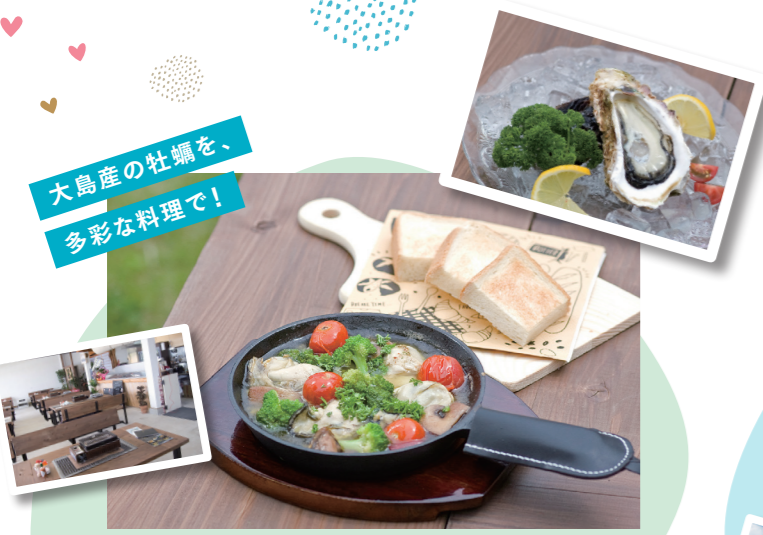
牡蠣のアヒージョ(バケット付)¥1,430

株式会社大島オイスターの直営店。自社ブランドの「夏心(なつごころ)」や1年中食べられる真牡蠣を使った多彩なメニューが勢揃い!