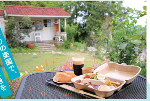
ランチの玉手箱B(ドラフトコーヒーのセット)¥2,300

オーナー夫妻が約5年の歳月をかけて作り上げたガーデンカフェ。美しいお庭と海を眺めながら高森牛のレアステーキやカスクートなどを堪能できます。